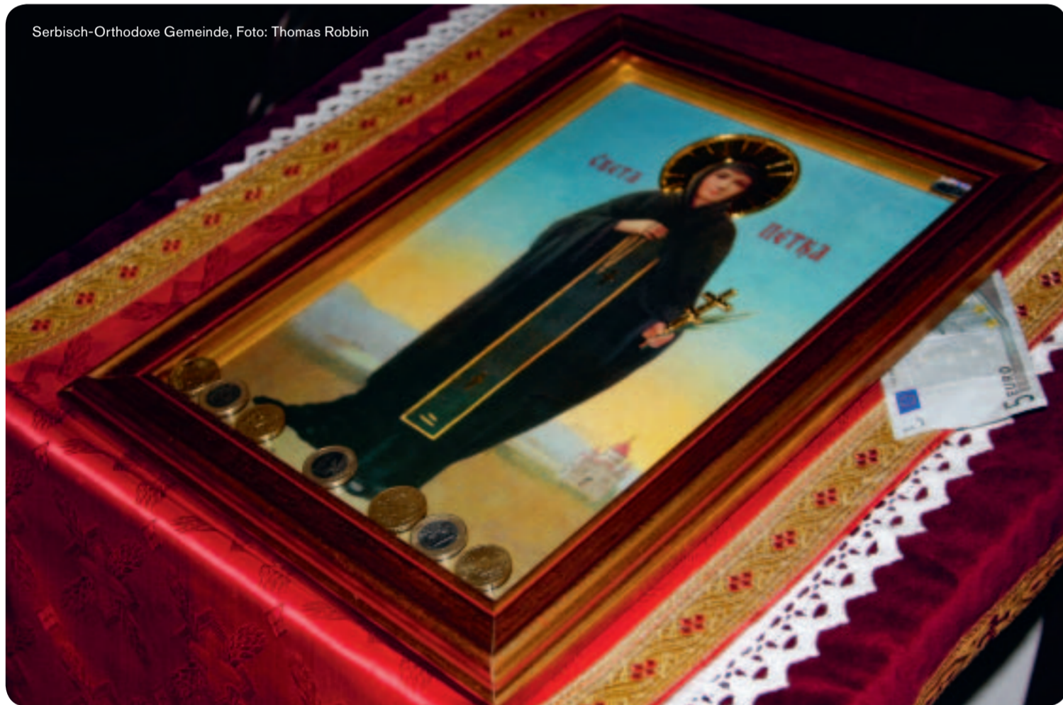
Serbisch-Orthodoxe Gemeinde, Foto: Thomas Robbin