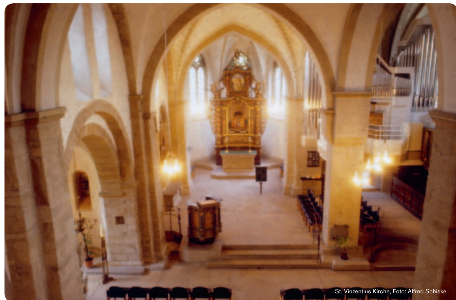
St. Vinzenius Kirche