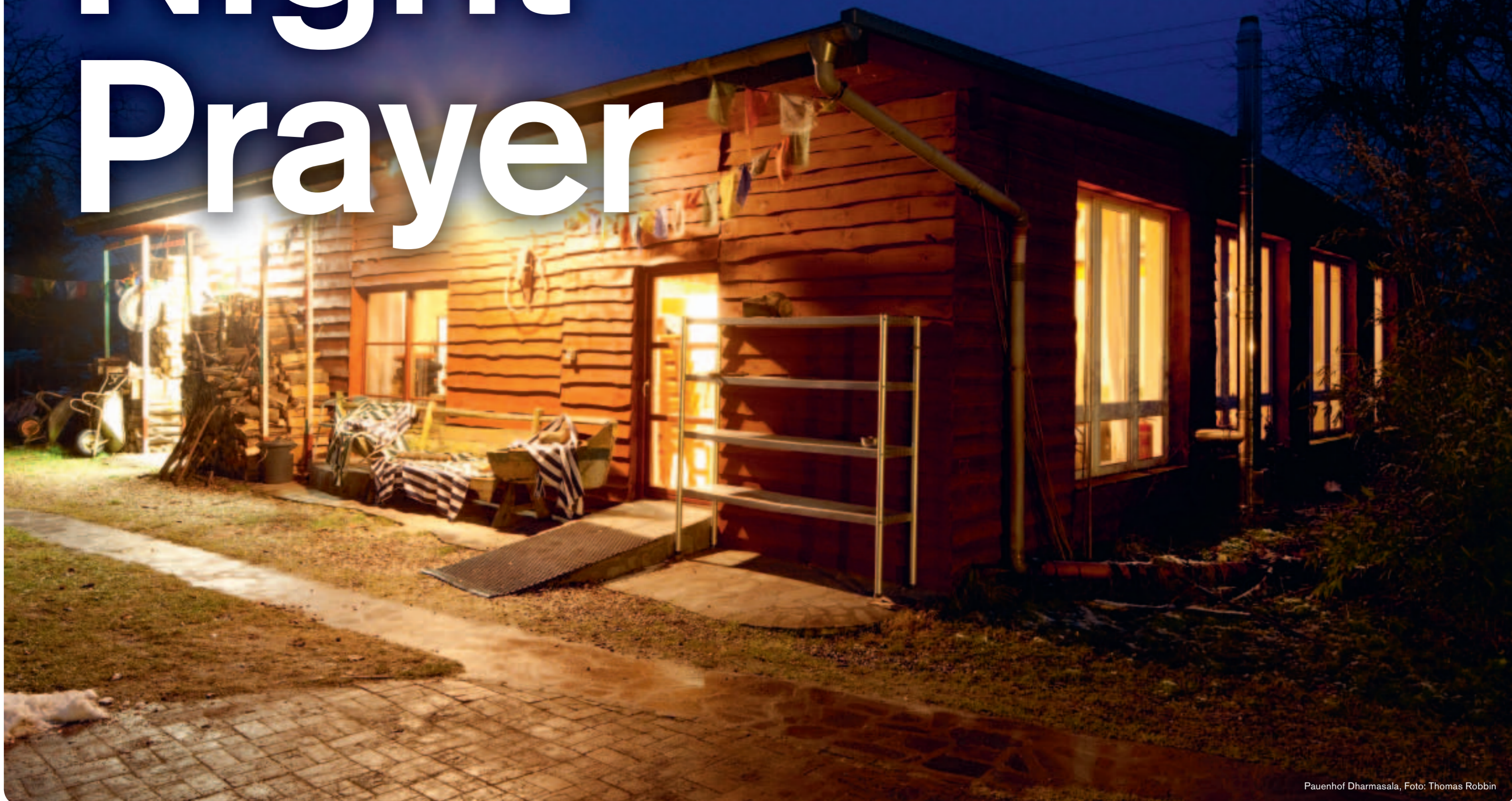
Pauenhof Dharmasala, Foto: Thomas Robbin