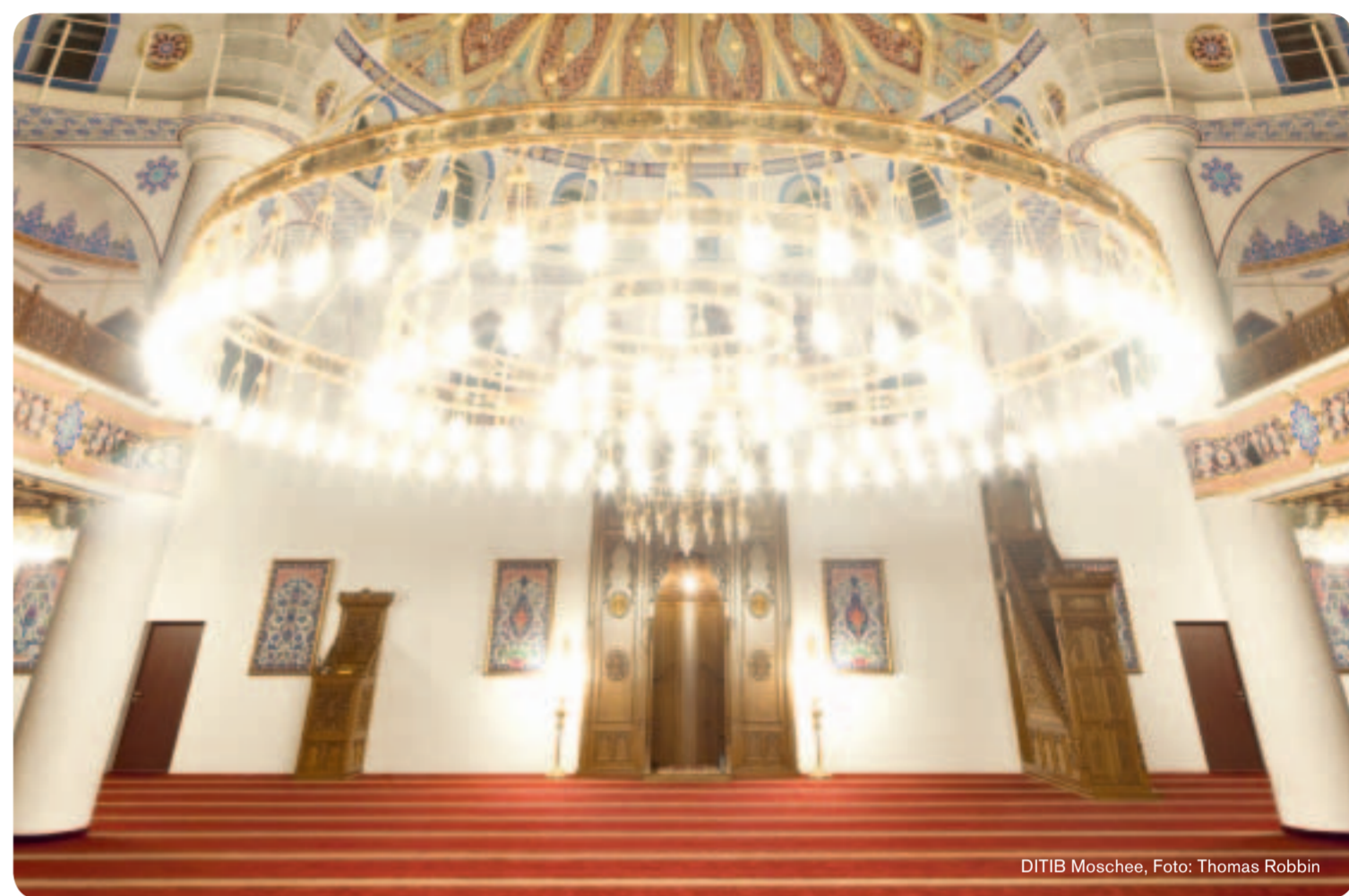
DITIB Moschee