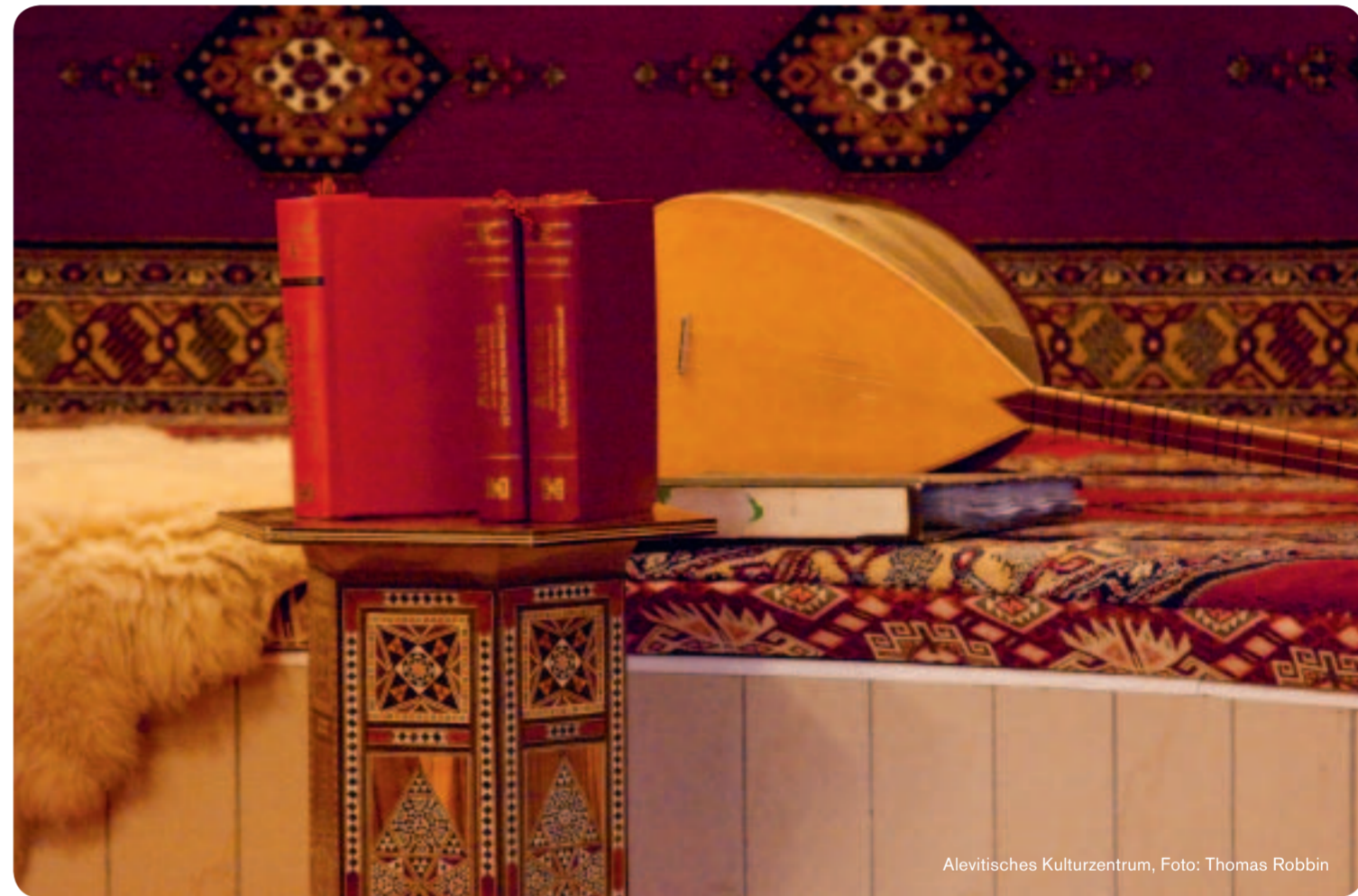
Alevisches Kulturzentrum