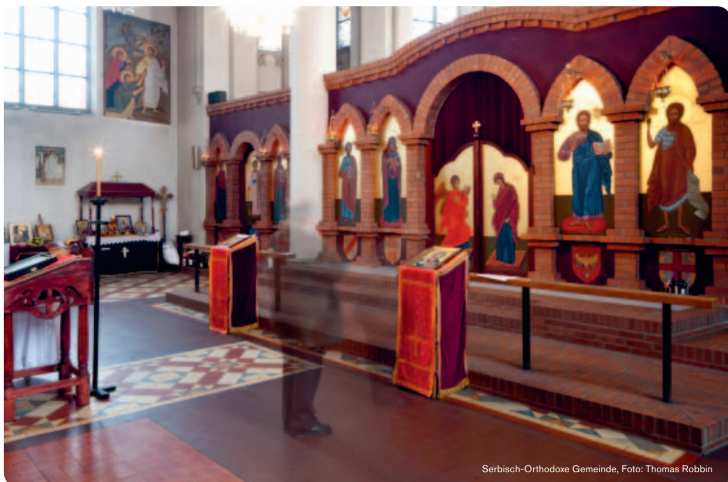
Serbisch-Orthodoxe Gemeinde