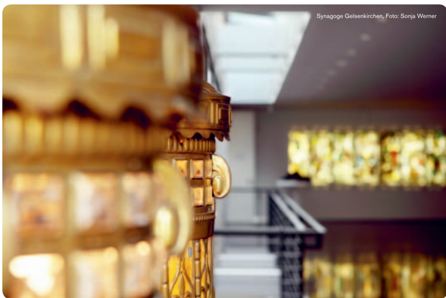
Synagoge Gelsenkirchen, Foto: Sonja Werner