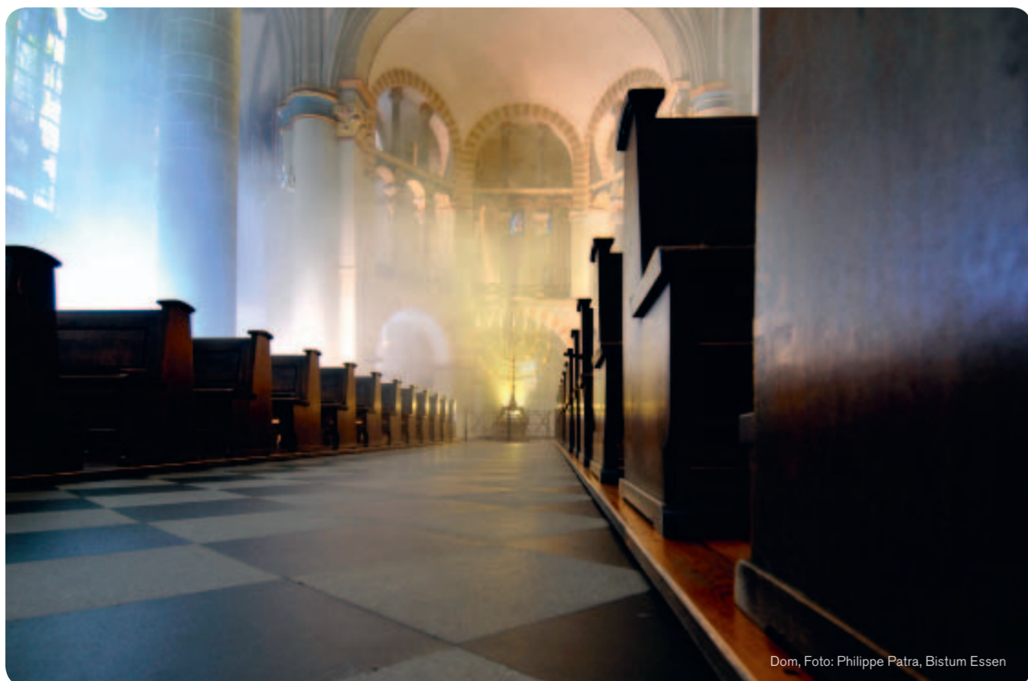
Dom, Foto: Philippe Patra, Bistum Essen