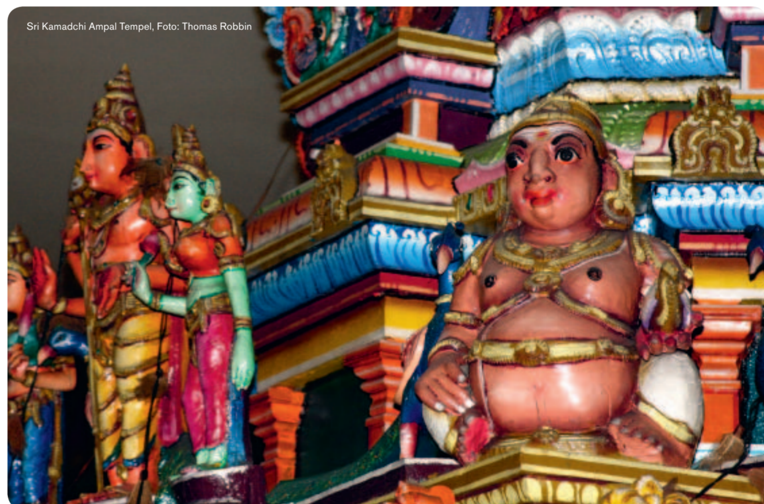
Sri Kamadchi Ampal Tempel